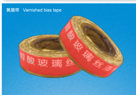
黄腊带 Varnished bias tape