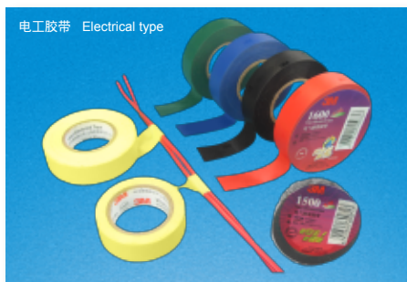
电工胶带 Electrical type